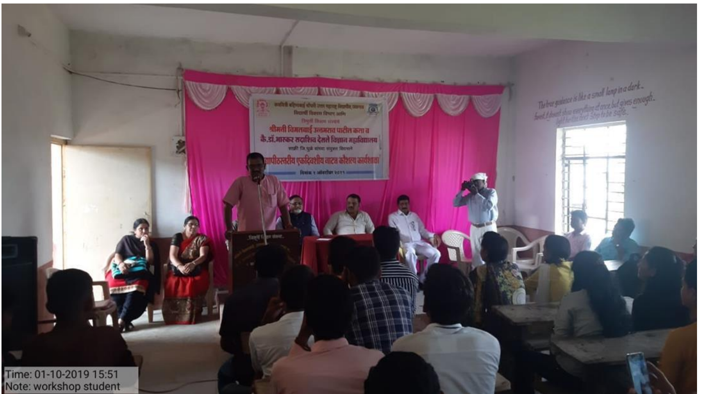
Time: 01-10-2019 15:51 Note: workshop student