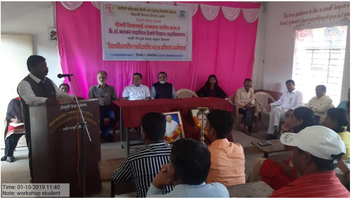
Time: 01-10-2019 11:40 Note: workshop student