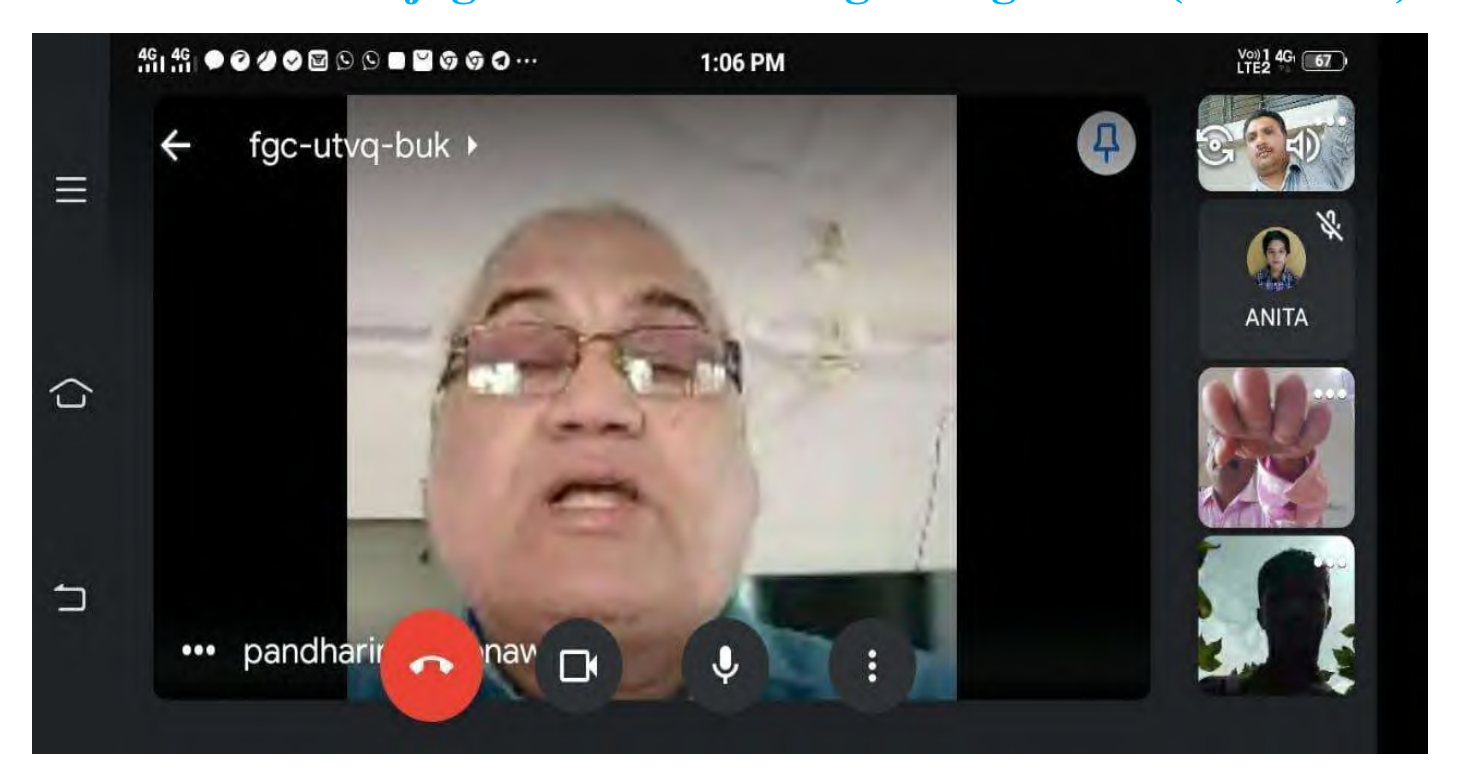
Vachan Prerna Diwas (15 Oct 2020)