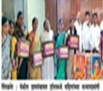
शनक, स्पर्धात स्ट्रेश अर्थ.

and such figures sphare some sorts and nonfirst from driver abot some gon wear a soil शने, हुवैत को एक समा siren am pelven afred at ex edu