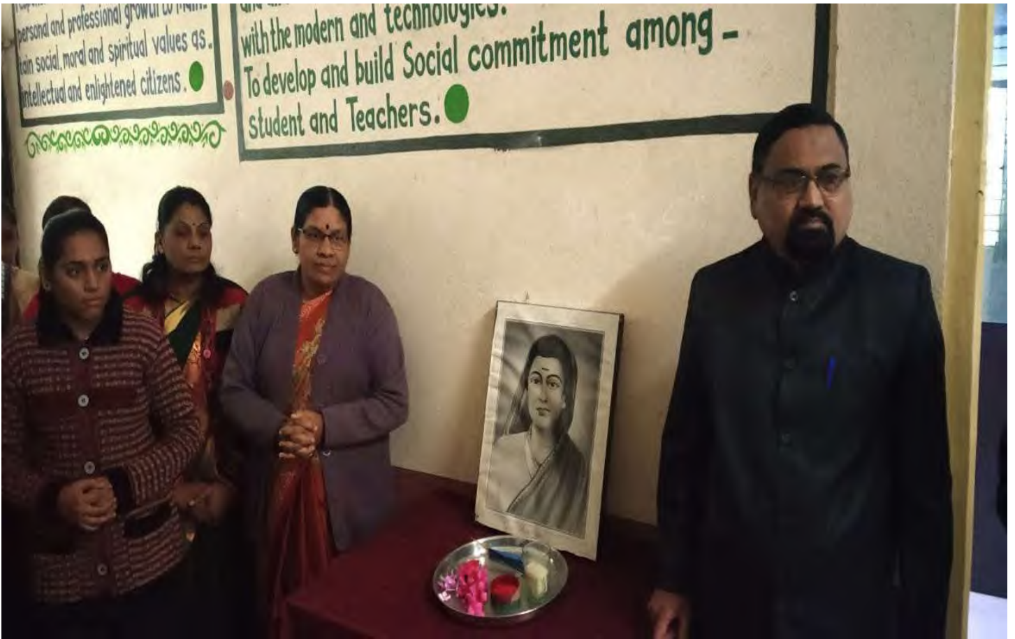
Republic Day (26 Jan 2021)