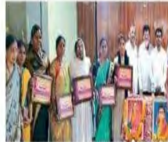
पिंपळनेर : येथील ग्रामपंचायत हॉलमध्ये महिलांच्या सन्मानप्रसंगी मान्यवर, सन्मानित महिला आदी.