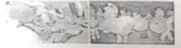
आदिवासींच्या जूज्यातील बावरी