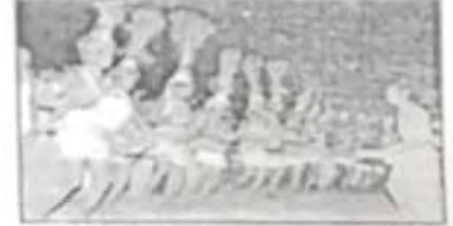
आदिवासींचे लोकी जूज्यातील बुज्याबाजा व बावरी