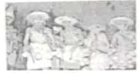
आदिवासींचे लोकी जूज्यातील बुज्याबाजा व बावरी

समाजापरिवर्तन आणि समाजीकरणार्थे कायम म्हणून शिक्षणाच येथील सगळ्या निजातेला आहे.