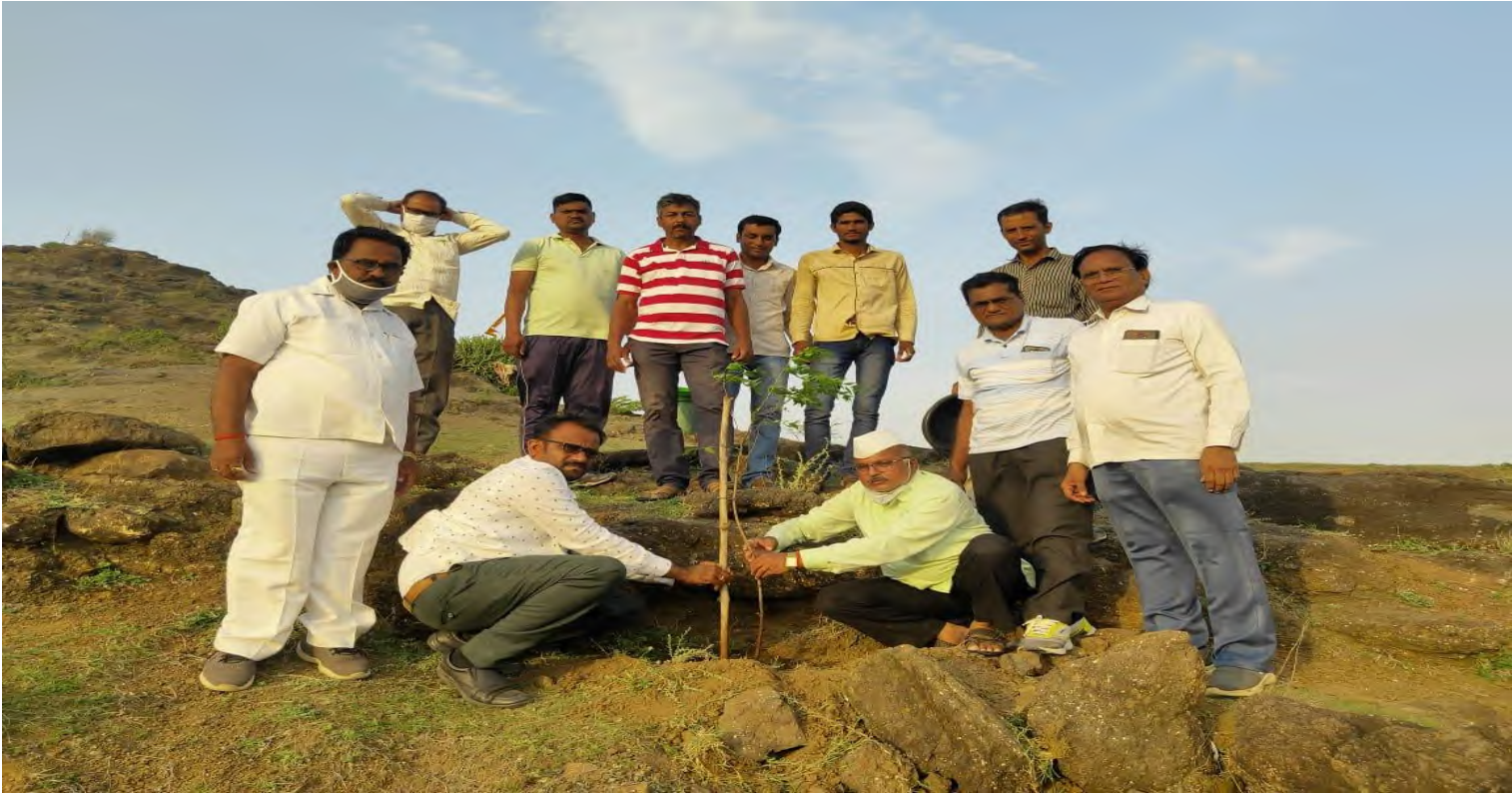
Evidences of Success